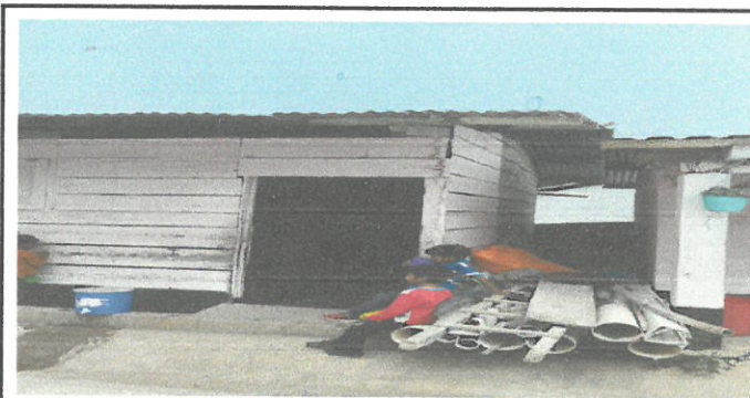
Foto 5: Sustitución de ventana de madera por ventana de metal y vidrio.