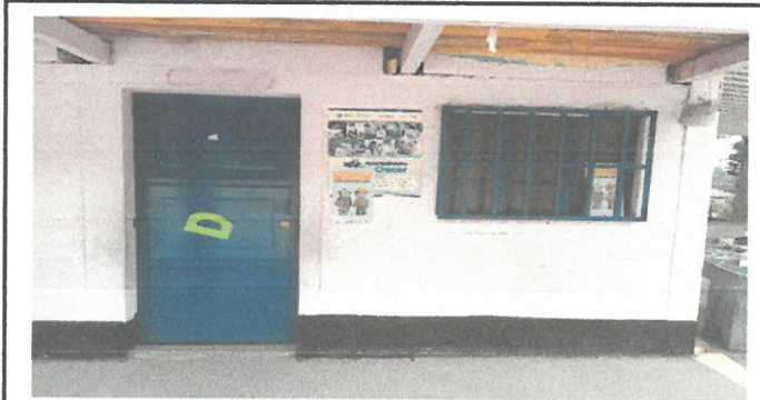
Foto 3: Aplicación de pintura en todas las puertas de las aulas de la escuela