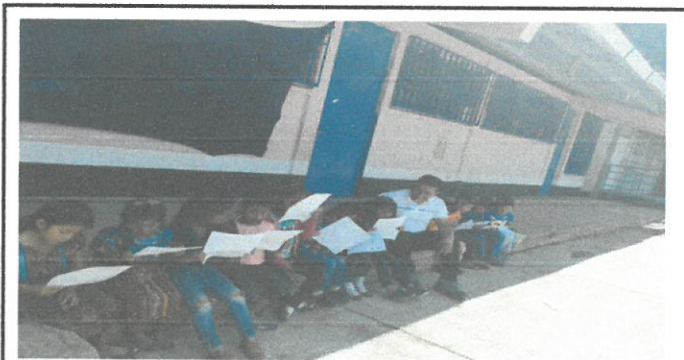
Foto 4: Aplicación de pintura en todas las puertas de las aulas de la escuela