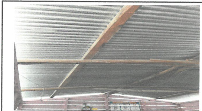
Foto 2: Sustitución de techo por láminas galvanizadas y estructura de metal.