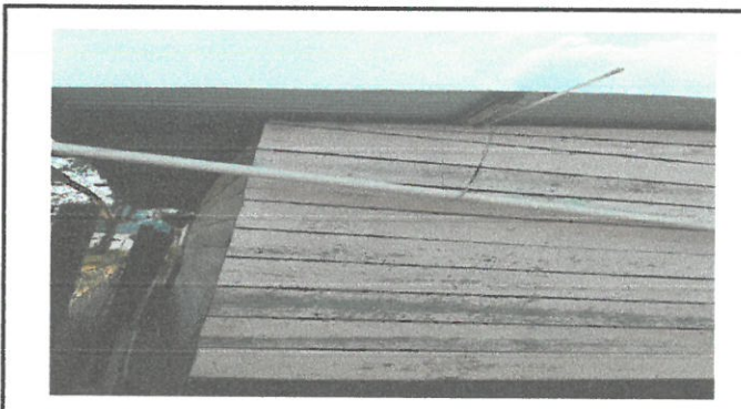
Foto 4: Sustitución de bajada de agua por canales galvanizados y tubo PVC.