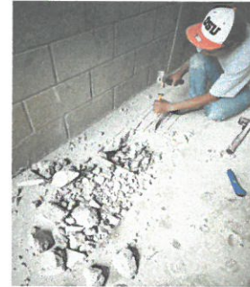
FOTO 6: Reparación de salida de fosa séptica hacia el pozo de absorción.

Observación: Si es necesario se pueden agregar hojas adicionales y aumentar el número de hojas.