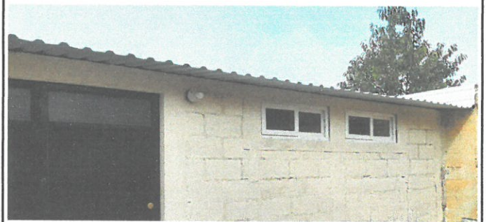
Vista frontal del techo nuevo para módulo de baños con lámina troquelada.