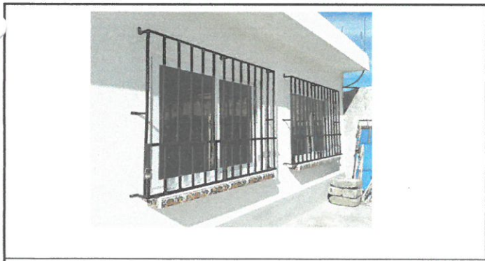
Balcones ya pintados e instalados en cocina.