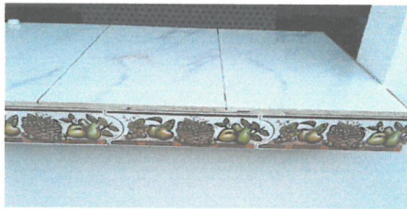
Vista de las encimeras ya terminadas y recubiertas con azulejos.