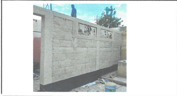
Muro perimetral para cepara baños de patio ya terminado