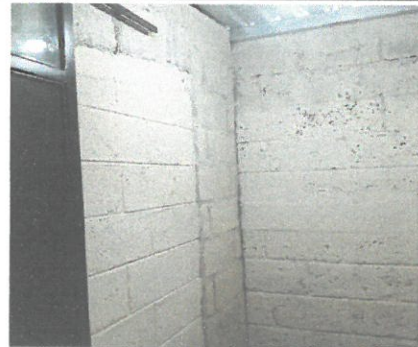
Pared que cerró espacio en baños ya terminado

Observación: Si es necesario se pueden agregar hojas adicionales y actualizar el número de hojas.