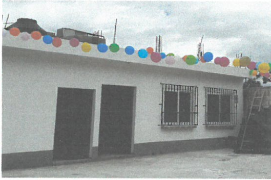
Vista frontal de cocina y bodega ya terminado con repello y cernido