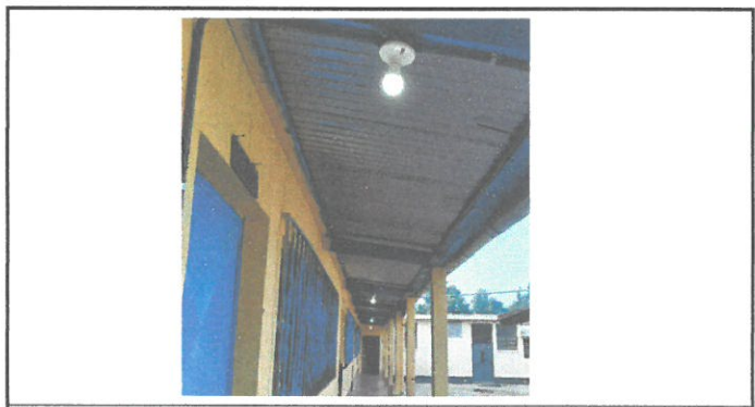
Sistema eléctrico en pasillo ya terminado.

Observación: Si es necesario se pueden agregar hojas adicionales y actualizar el número de hojas.