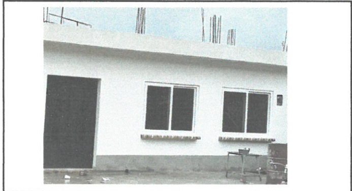
Ventanas en UPVC ya instalados en cocina.