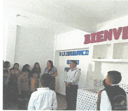
Vista interior de la cocina ya terminada con repello y cernido