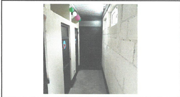
Puertas ya instaladas en baños.