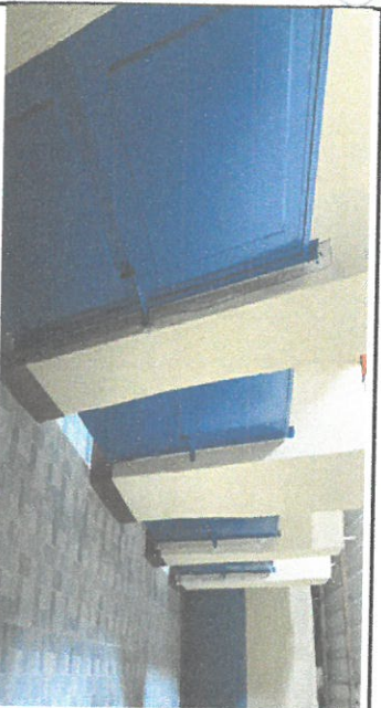
SUSTITUCION DE PUERTAS DE METAL PARA SERVICIOS SANITARIOS