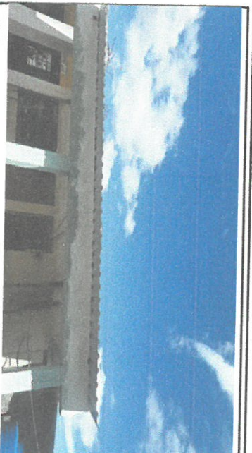
SUSTITUCION DE LAMINAS GALVANIZADAS CALIBRE 26, Y ESTRUCTURA DE TECHO DE METAL PARA LA BODEGA