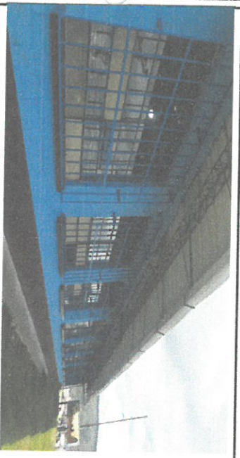
SUSTITUCION DE 9 BALCONES DE 3 AULAS

Observación: Si es necesario se pueden agregar hojas adicionales y actualizar el número de hojas.