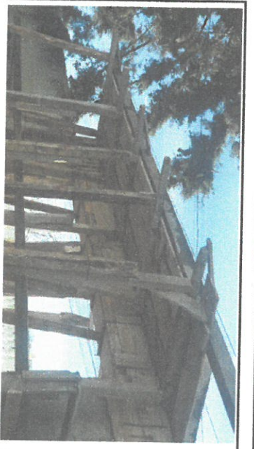
Sustitucion de porton 2.97X 2.88 metros