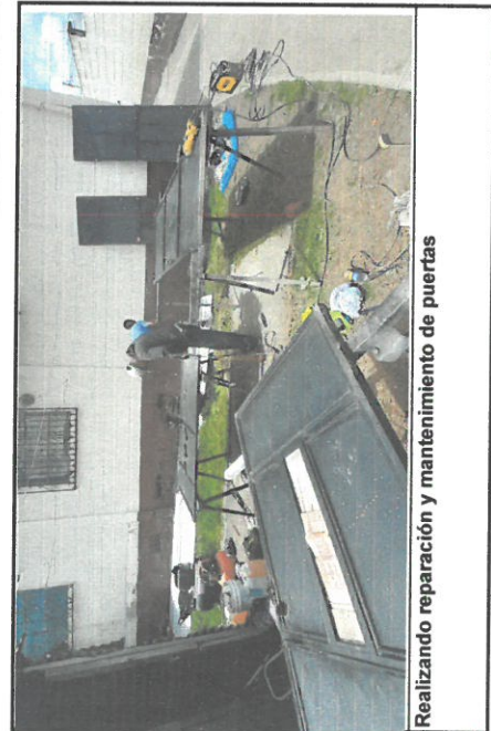
Realizando reparación y mantenimiento de puertas