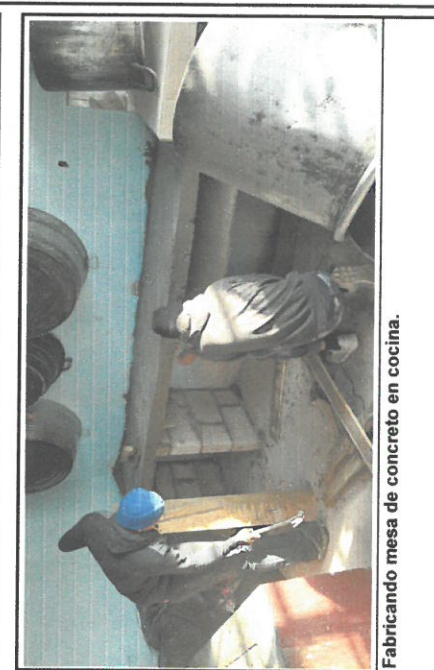
Fabricando mesa de concreto en cocina.