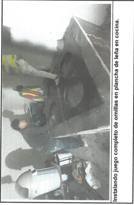
Instalando juego completo de ornillas en plancha de leña en cocina.