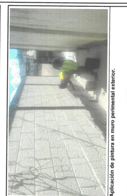
Aplicación de pintura en muro perimetral exterior.

Observación: Si es necesario se pueden agregar fotos adicionales y actualizar el número de hojas.