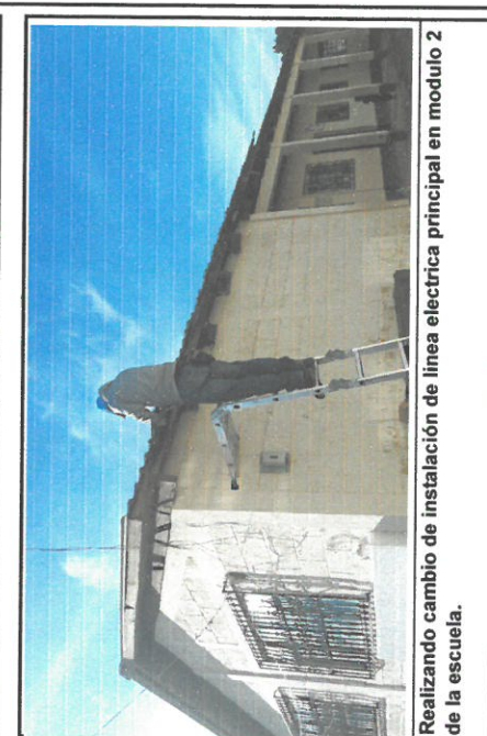
Realizando cambio de instalación de línea eléctrica principal en modulo 2 de la escuela.