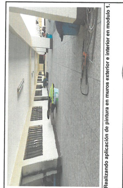
Realizando aplicación de pintura en muros exterior e interior en modulo 1.