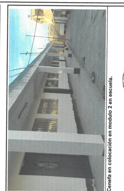
Cenefa en colocación en modulo 2 en escuela.

Observación: Si es necesario se pueden agregar hojas adicionales y actualizar el número de hojas.