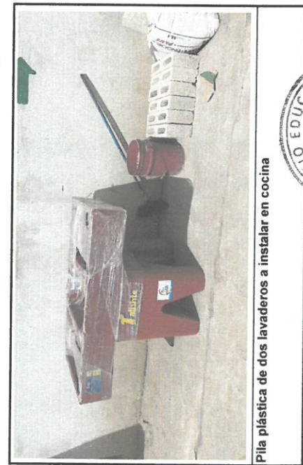
Pila plástica de dos lavaderos a instalar en cocina