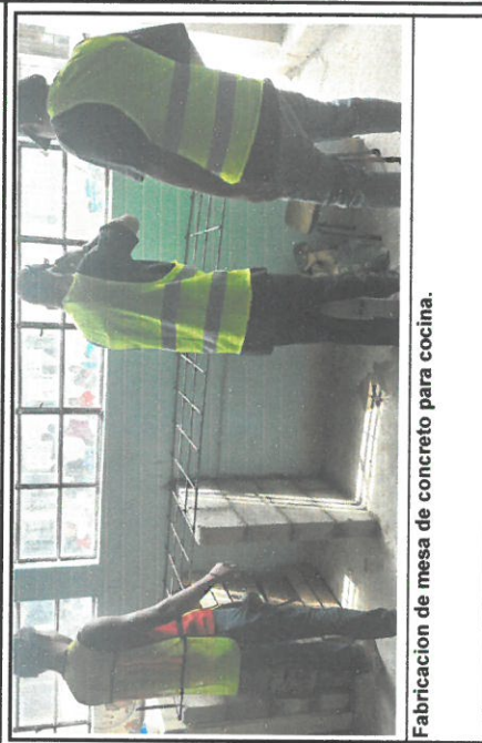
Fabricacion de mesa de concreto para cocina.