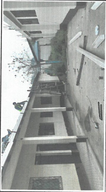
Colocación de canaletas y bajadas de agua en módulo 2 de la escuela.

Observación: Si es necesario se pueden agregar hojas adicionales y actualizar el número de hojas.