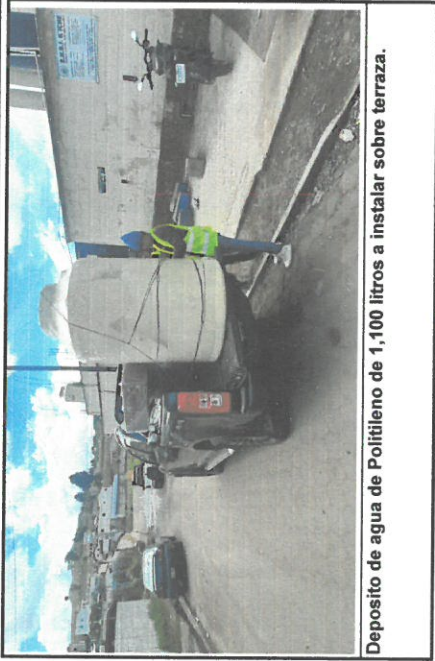
Deposito de agua de Polietileno de 1,100 litros a instalar sobre terraza.