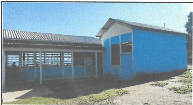
Foto 3: Pintura de módulo 1, vista exterior, torta de cemento en patio y puerta corrediza de metal.