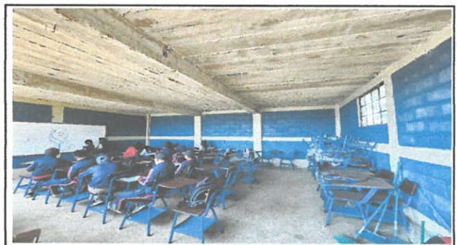
Foto 6: Instalación eléctrica en módulo 2. Primer piso (focos y tomacorrientes)

Observación: Si es necesario se pueden agregar hojas adicionales a actualizar el número de hojas.