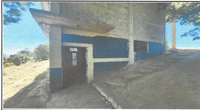
Foto 3: Primer piso módulo 2: Instalación de varandas de 4 ventanas y una puerta