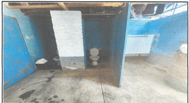
Foto 4: Baño de varones: instalación de azulejo en piso y paredes, lavamanos de concreto, remplazo de inodoros, plomería completa.