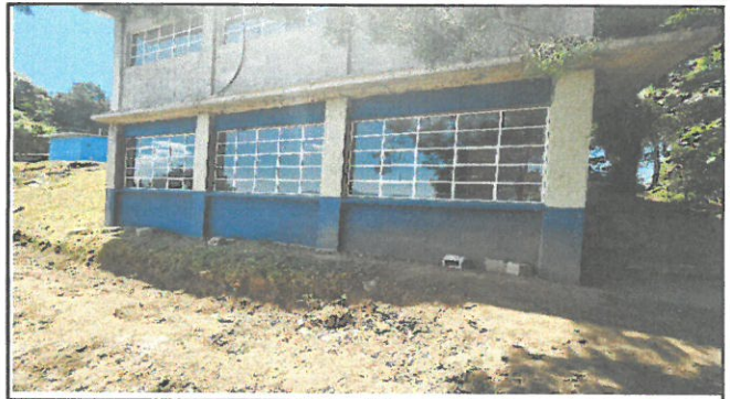
Foto 2: Primer piso módulo 2: Instalación de varandas de 4 ventanas y una puerta