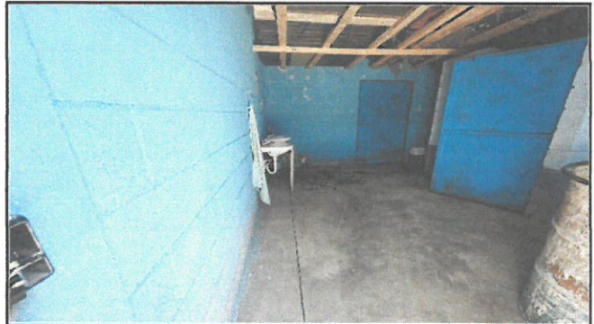
Foto 2: Baño de varones: instalación de azulejo en piso y paredes, lavamanos de concreto, remplazo de inodoros, plomería completa.