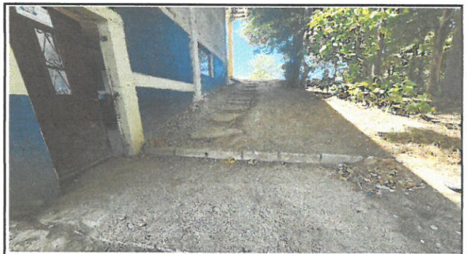
Foto 4: Primer piso módulo 2: Construcción de rampa y gradas de acceso