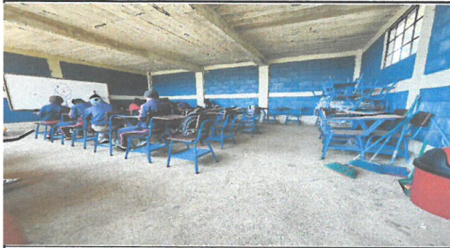
Foto 1: Primer piso módulo 2: instalación de piso y alisado de cielo