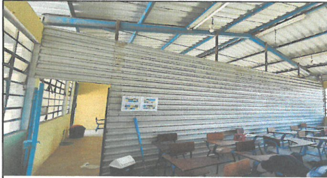
Foto1: División de salón con tabla yeso