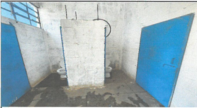
Foto 3: Baño de señoritas: instalación de azulejo en piso y paredes, lavamanos de concreto, remplazo de inodoros, plomería completa.