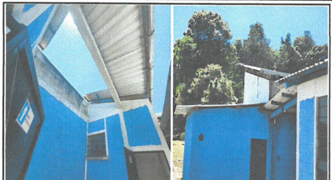
Foto 2: Instalación de 2 depósitos de agua sobre los techos y canaletas.