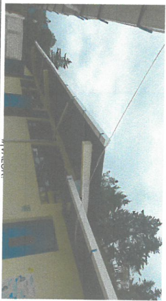
Foto 4: Sustitución de canales y bajadas de aguas pluviales correspondientes a 36 metros lineales