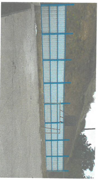
Foto 6: Instalación de estructura de protección de lámina calibre 24 con tubo galvanizado.

Observación: Si es necesario se pueden agregar hojas adicionales y actualizar el número de hojas.