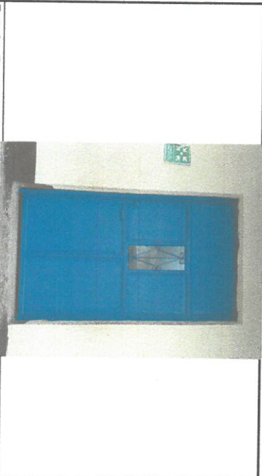
Foto1: . Reparacion, mantenimiento y pintada de 7 puertas de cocina, salón y dirección.