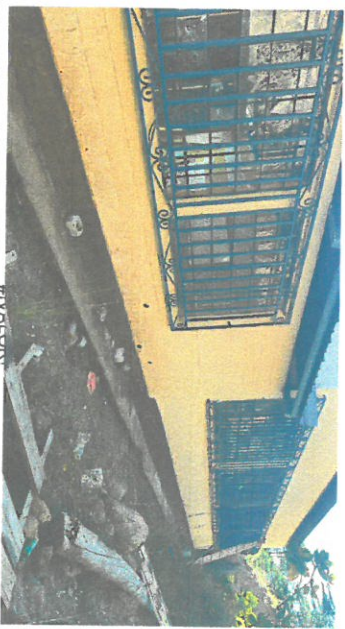
Foto 2: Colocación de balcones en tres aulas, equivalentes a 35 metros cuadrados