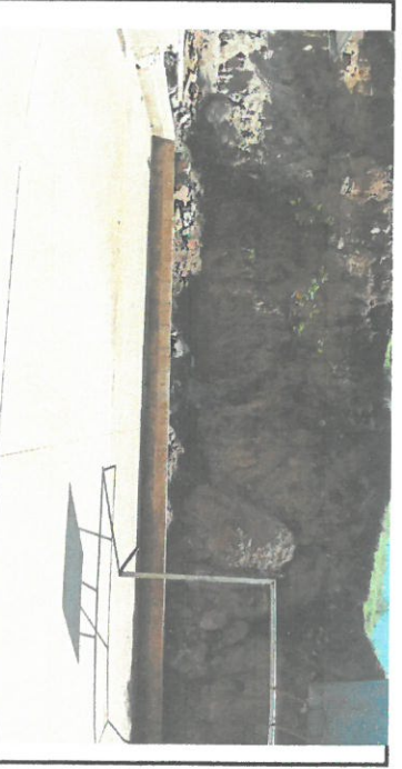
Foto 6: Instalación de estructura de protección de lámina calibre 24 con tubo galvanizado.

Observación: Si es necesario se pueden agregar hojas adicionales y actualizar el nivel de Deficiencias.