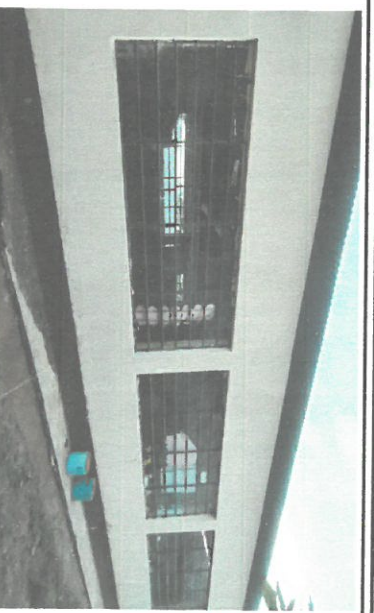
Foto 2: Colocación de balcones en tres aulas, equivalentes a 35 metros cuadrados