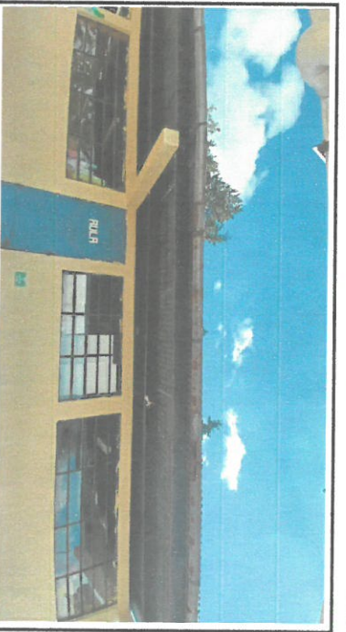
Foto 4: Sustitución de canales y bajadas de aguas pluviales correspondientes a 36 metros lineales