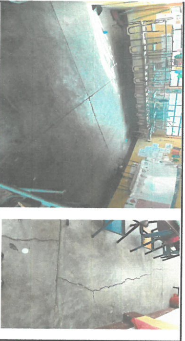
Foto 3: Sustitución de piso de cemento por piso de granito para 3 aulas