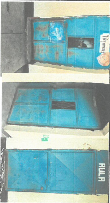
Foto 1: Reparación, mantenimiento y pintada de 7 puertas de cocina, salón y dirección.