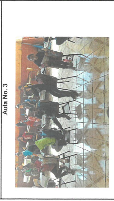
Aula No. 3