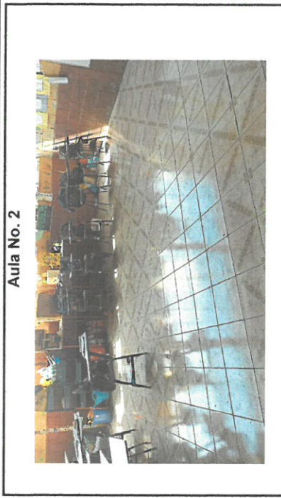
Aula No. 2