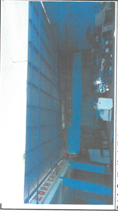
Foto 1: Sustitución de láminas por lámina troquelada aluzinc calibre 26