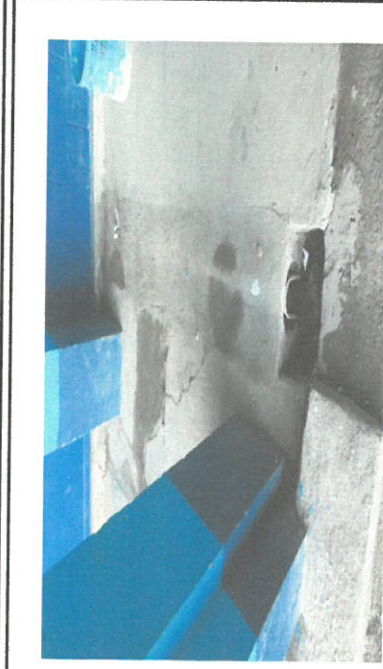
Foto 8: Sustrucción de tubería PVC línea pluviales en el patio de la escuela