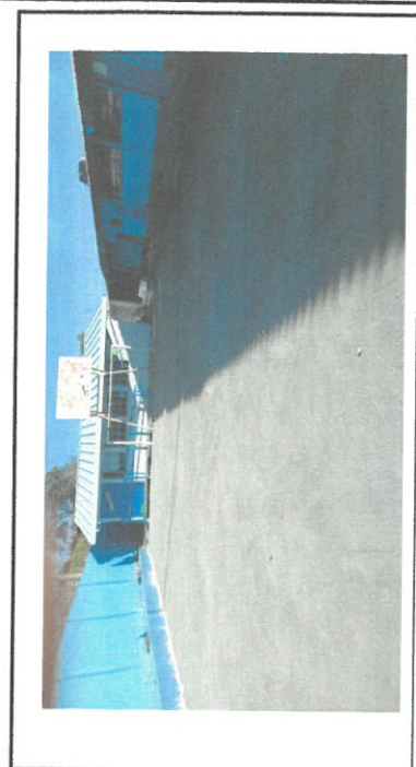
Foto 6: Sustitución de piso en patio dañado, por pavimento de concreto con espesor de 10 cms

Observación: Si es necesario se pueden agregar hojas adicionales y actualizar el número de hojas.