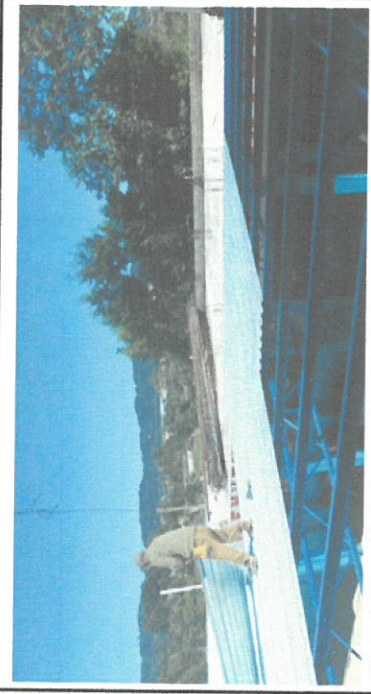
Foto1: Sustitución de láminas por lámina troquelada aluzinc calibre 26