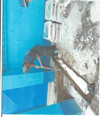
Foto 8: Sustitución de tubería PVC línea pluviales en el patio de la escuela