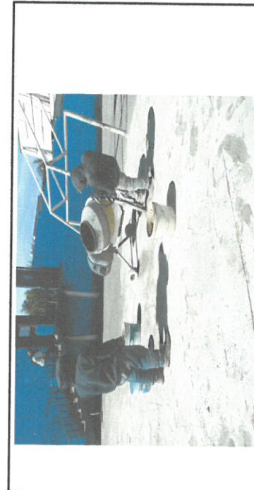
Foto 6: Sustitución de piso en patio dañado, por pavimento de concreto con espesor de 10 cms

Observación: Si es necesario se pueden agregar hojas adicionales y actualizar el número de hojas.