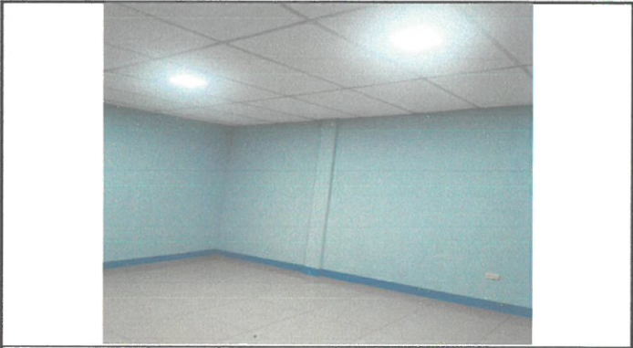
Foto 4: DIRECCIÓN Y BODEGA MEJORADO CON REPELLO, CON PISO CERAMICO, CON RED ELECTRICA MEJORADA, PINTADO, PUERTA, VENTANA Y CIELO FALSO.