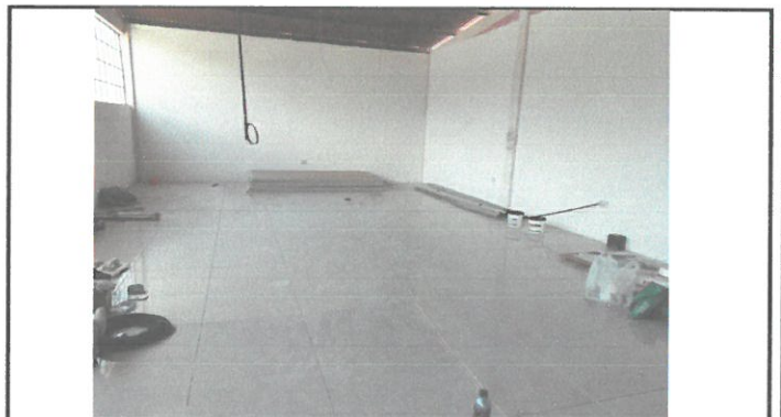
Foto 4: BODEGA Y DIRECCIÓN EN PROCESO DE REPELLO Y COLOCACIÓN DE PISO.