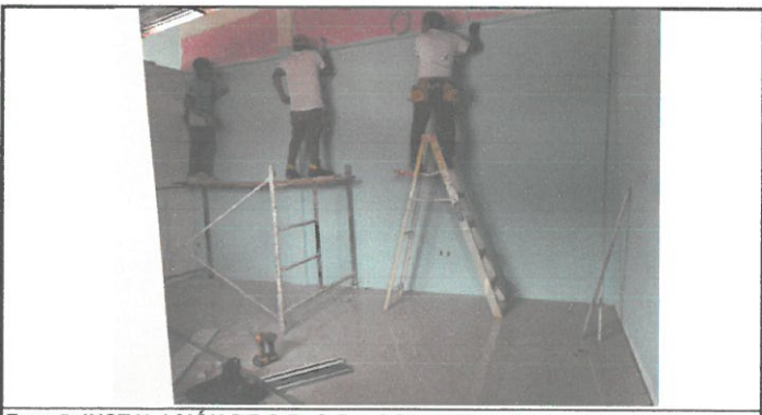
Foto 5: INSTALACIÓN DE CIELO FALSO Y PARED CON TABLAYESO EN PROCESO DE EJECUCIÓN.