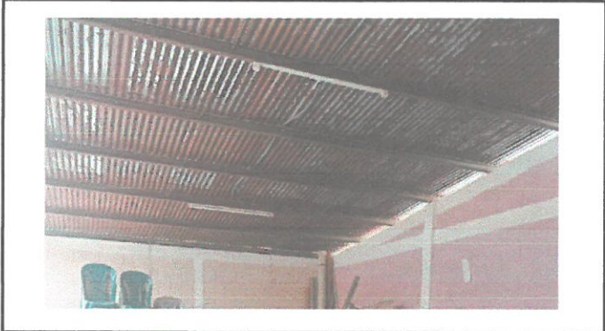
VISTA INTERNA DE DIRECCION PARA INSTALACIÓN DE CIELO FALSO