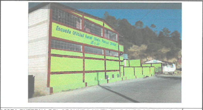
VISTA EXTERNA DEL SEGUNDO NIVEL EN DONDE SE REMOZARÁ DIRECCIÓN Y BODEGA