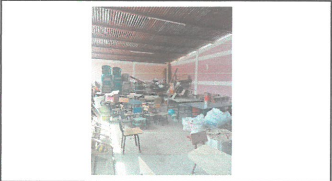
VISTA INTERNA DE DIRECCIÓN Y BODEGA A REPELLAR CON SUSTITUCIÓN DE PISO DE CEMENTO A PISO CERÁMICO