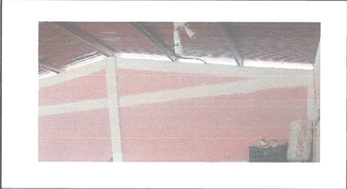
VISTA INTERNA DE DIRECCIÓN Y BODEGA PARA REPARACIÓN DE RED ELECTRICA