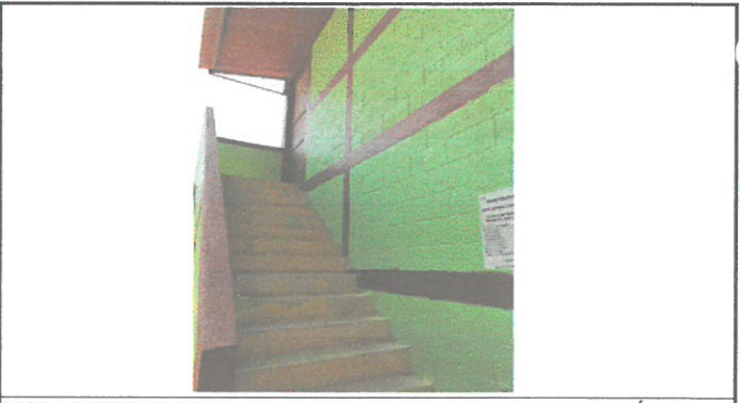
VISTA EXTERNA DE INGRESO A SEGUNDO NIVEL DE DIRECCIÓN Y BOEGA A REMOZAR

Observación: Si es necesario se pueden agregar hojas adicionales y actualizar el número de hojas.