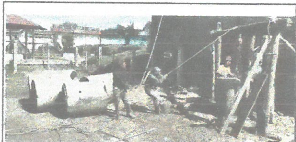
instalacion de tubos de concreto en pozo

Observación: Si es necesario se pueden agregar hojas adicionales y actualizar el número de hojas.