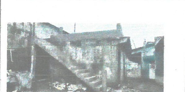
vista general de remozamiento