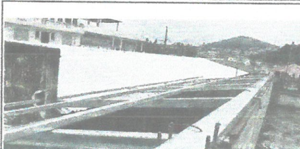
sustitucion de laminas