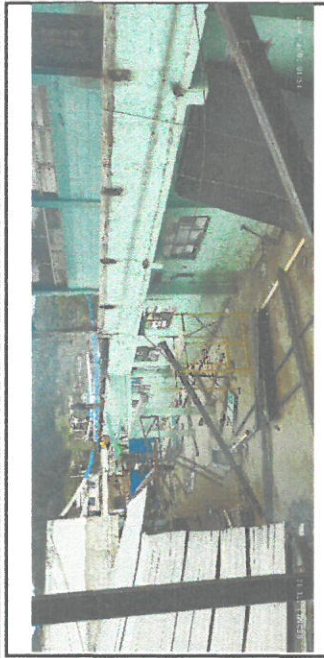
Foto 2: Retiro de la estructura que sostenía las láminas anteriores