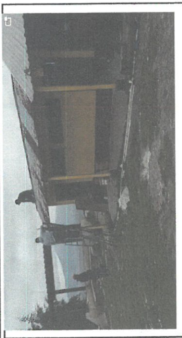
SUSTITUCIO DE LAMINAS TROQUELADAS DE BAÑOS