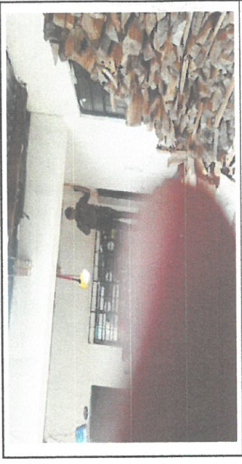
MEJORAMIENTO DE RED ELECTRICA EN TODO EL ESTABLECIMIENTO

Observación: Si es necesario se pueden agregar fotografías, realizar el número de hojas. CONSEJO ESCOLAR SAN FRANCISCO EL ALTO F. U. M. J. V. Firma y sello del Presidente del CPE NIVEL 13.