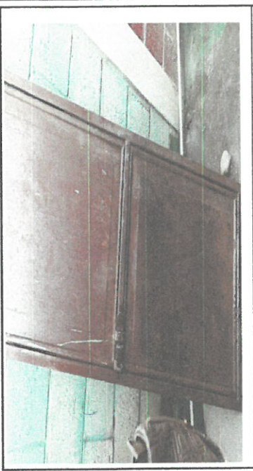
SUSTITUCION DE PUERTAS DE BAÑO