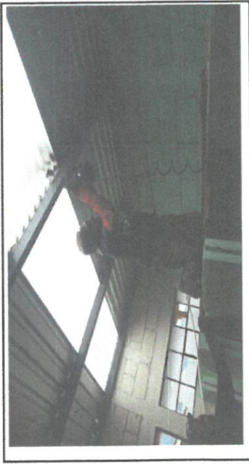
PINTURA DE COSTANERAS