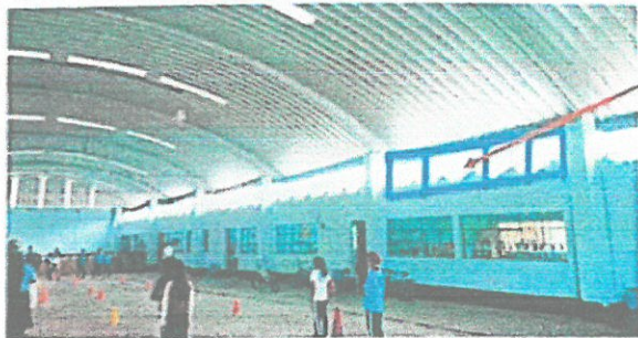
espacio a cubrir, porque ingresa lluvia en este espacio