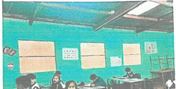
ventanas modulo 2