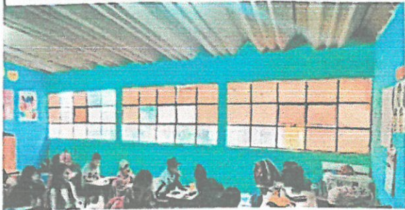
ventanas a cambiar modulo 1