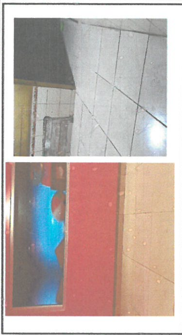
Foto 2: reodelcion de la direccion, clacion de pisos y cambios de vidrio ya terminados