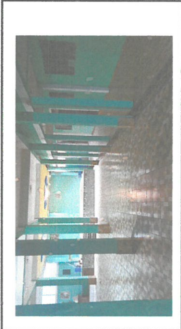
Foto1: pintura interior del establecimiento y aulas ya finalizado