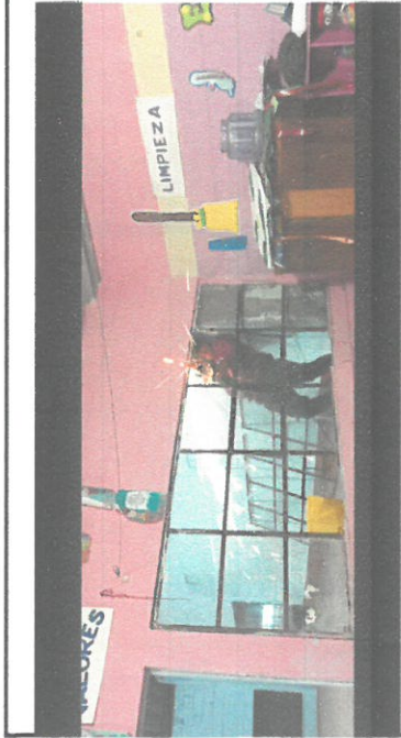
Foto 3: Vista frontal del establecimiento de los modulos de cambio de ventanas de PVC en proceso