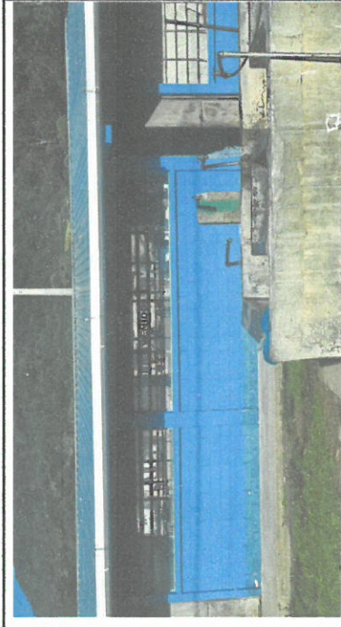
Foto 1: La pared exterior del modulo 1, 2, 3, 4 y 5 se están pintando y las puertas se pintan y colocación de chapas