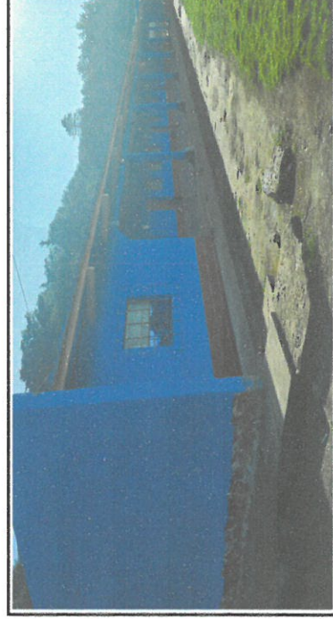
Foto 6: modulos 2 y tres aplica la pintura en paredes exteriores y puertas

Observación: Si es necesario se pueden agregar hojas adicionales y actualizar el número de hojas.