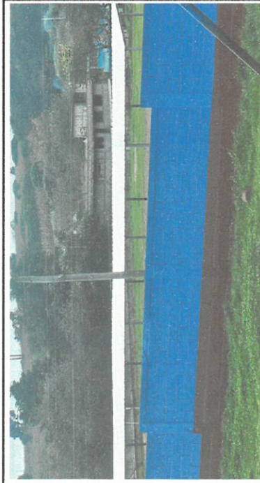
Foto 3: El muro perimetral se esta pintando en la parte frontal interna y los laterales internos, y una parte del exterior del modulo 1 que esta en el area de la parte de atrás.