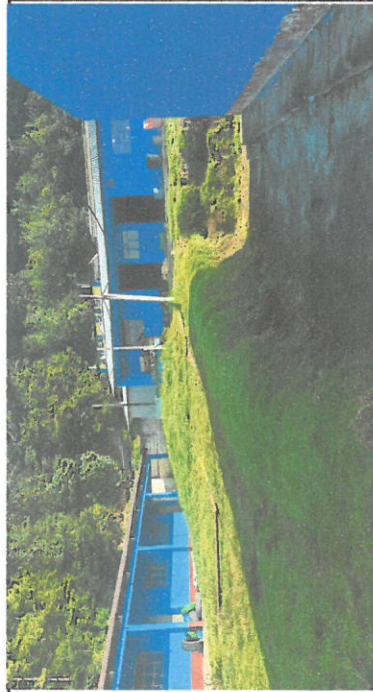
Foto 5: Modulo 4 se aplica pintura exterior, cocina pintando en la pared exterior