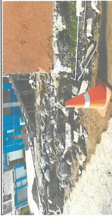
Foto 11: Muro perimetral de block en la entrada principal al establecimiento