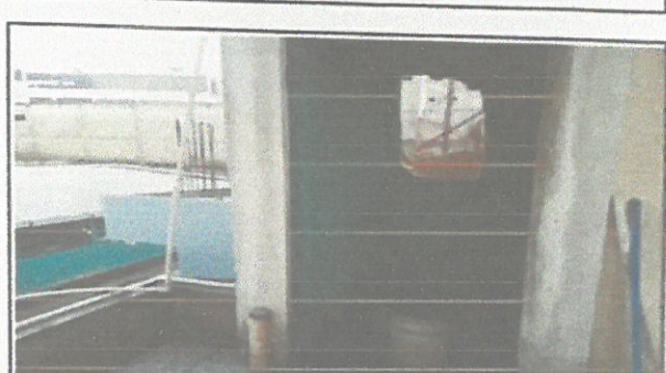
Destroncamiento de area donde se instalara una puerta

Observación. Si es necesario se pueden agregar hojas adicionales y actualizar el número de hojas.