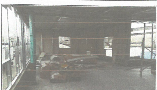
Cubierta de piso en el area de remosamiento