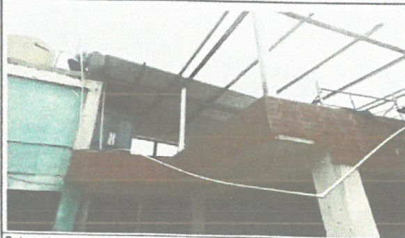
Colocacion de estructura de metal en techo