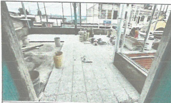
Colocación de piso de granito en el area