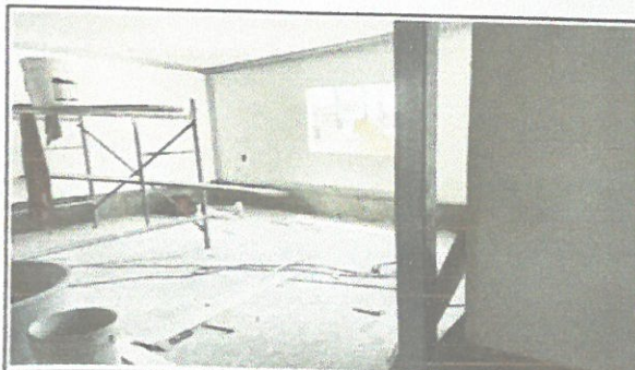
Colocación de cielo falso