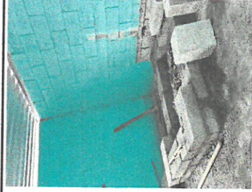
Foto1: vista de en el interior de cocina trabajando con la plancha