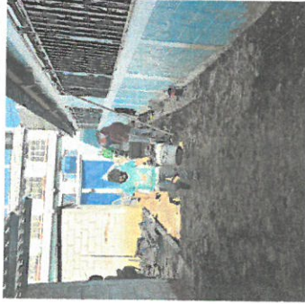
Foto 5: vista de pasillo trabajando, que conduce a bodega y cocina