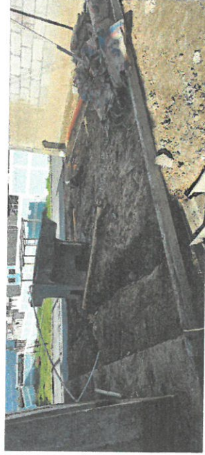
Foto 4: vista de parte de patio en frente de cocina, trabajando suelo natural cubierto con piedrin con piso de concreto