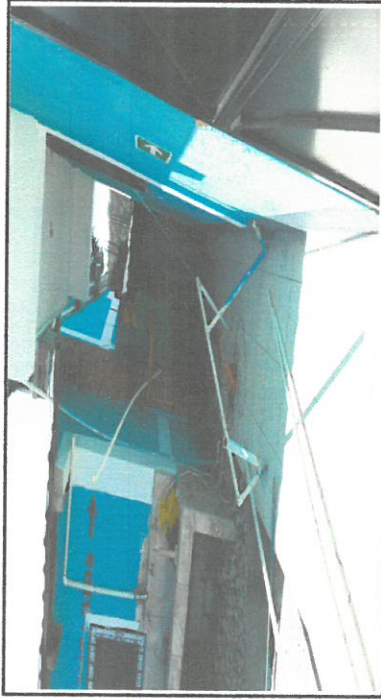
Foto 3: Sustitución de tubería PVC línea principal, aguas pluviales.