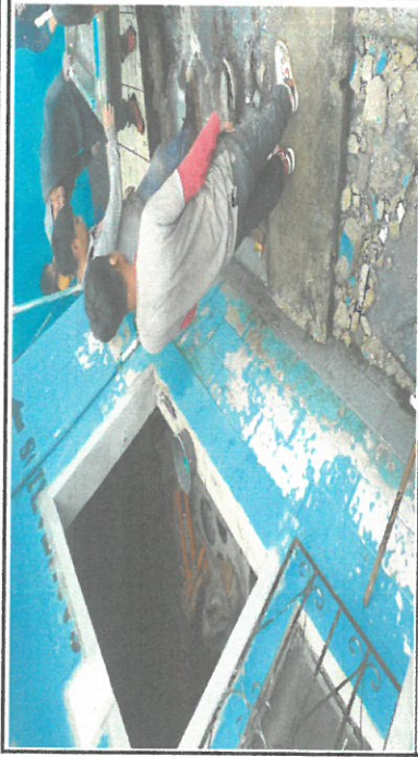
Foto 1: Ampliación de ventanas para mejoramiento de iluminación (cocina)