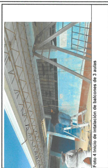
Foto 4 Inicio de intalación de balcones de 3 aulas