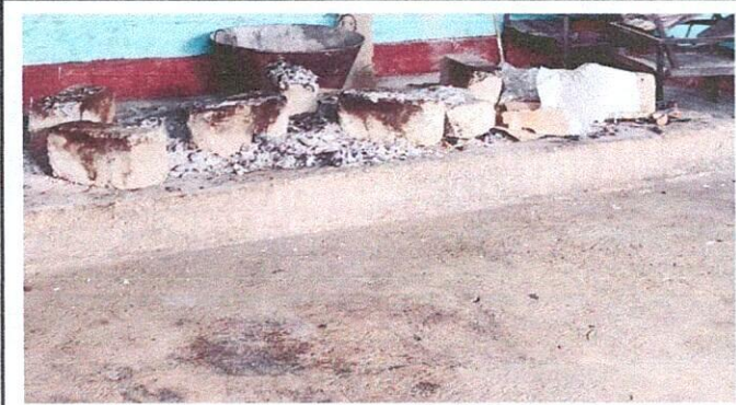
Piso de cocina en mal estado