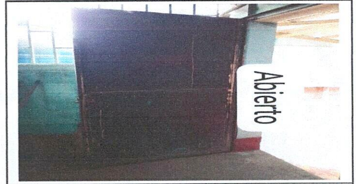
Puerta en mal estado.

Observación: Si es necesario se pueden agregar fotografías adicionales y actualizar el número de hojas.