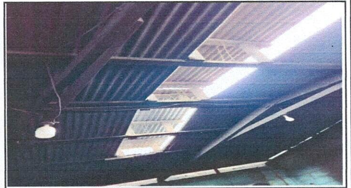
Cubierta de lámina en mal estado.