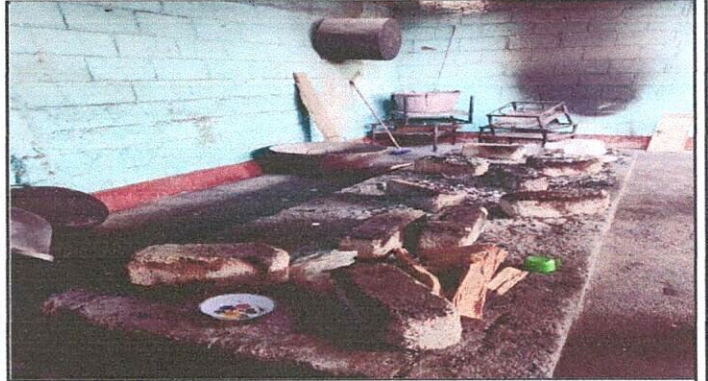
Plancha rural en mal estado