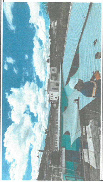
Foto 2: Tomando medidas para la colocacion de las laminas de la cocina de la Escuelita.