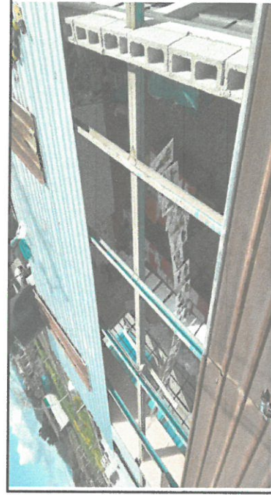
Foto 4: Instalando y desinstalando las laminas antiguas por las nuevas.