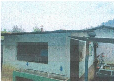
Foto 1: Área de sustitución de lamina acanalada por lamina troquelada incluye canalización de agua pluvial