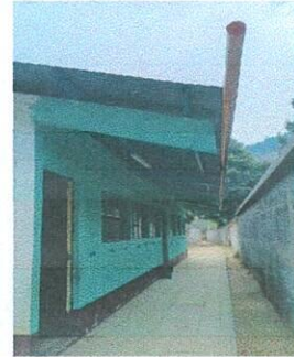
Foto 2: Aula 1 y 2 sustitución de tubo PVC por canal caudal y bajadas de agua pluvial