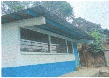
Foto 3: Aula 3 instalación de canal caudal y bajadas de agua pluvial