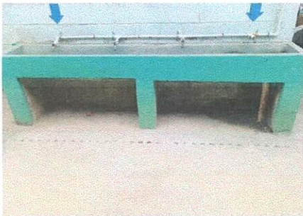
Foto 5: Sustitución de grifos e instalación de azulejo en lavamanos de concreto