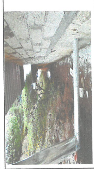
Foto 3: colocación de canales y estructuras pescentes, bajadas de agua.