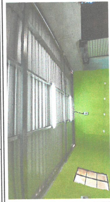
Foto1: Cambio de instalación eléctrica, lámparas led, toma corrientes, filipon.