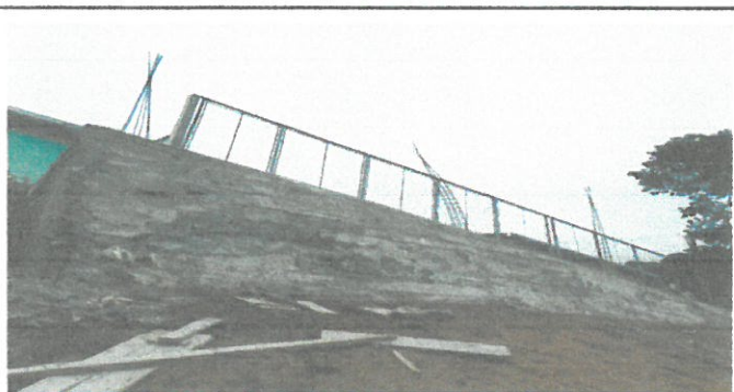
Finalización de muro