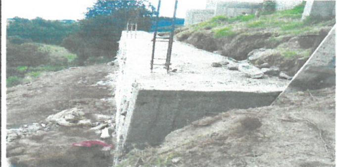
Tallado de esquinas y cuadro de muro