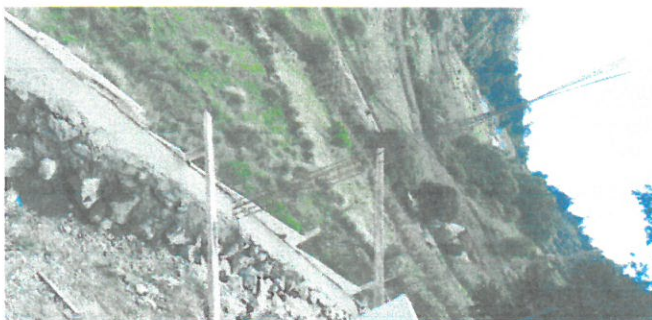
Vista aerea de muro