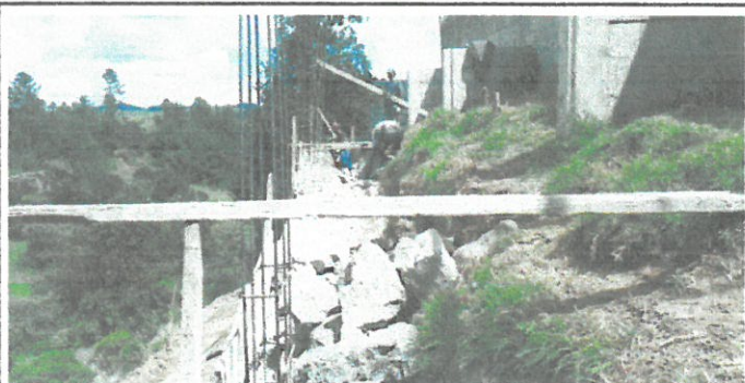
Relleno y fundición de muro