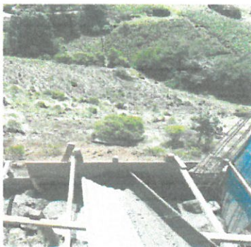
Fundición de muro

Observación: Si es necesario se pueden agregar hojas adicionales y actualizarlas en las hojas.