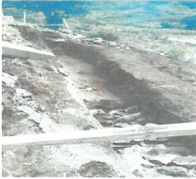
Inicio de Muro