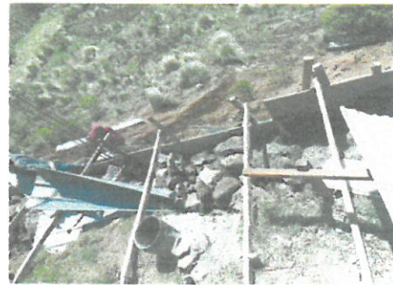
Vista aerea de avance de muro