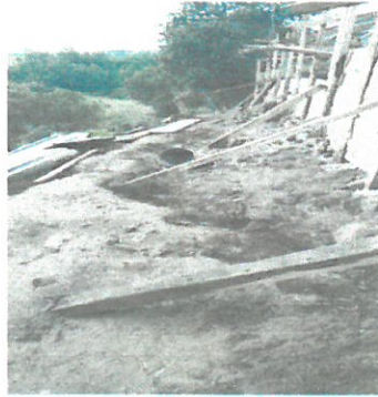
Avance de muro