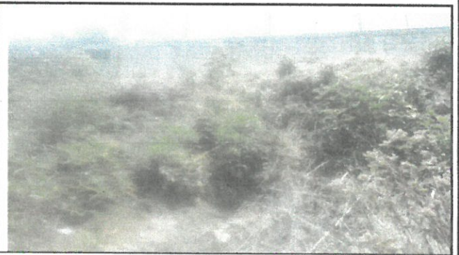
Area a fortalecer de muro perimetral