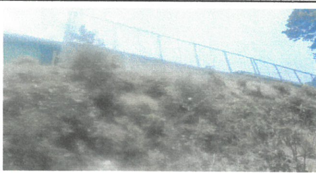
Area a fortalecer de muro perimetral