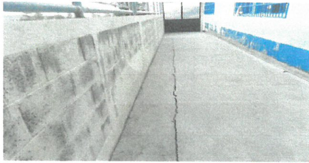
Vista interna de muro perimetral