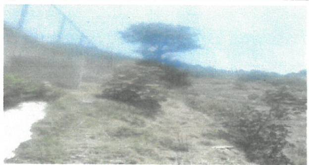
Area a fortalecer de muro perimetral