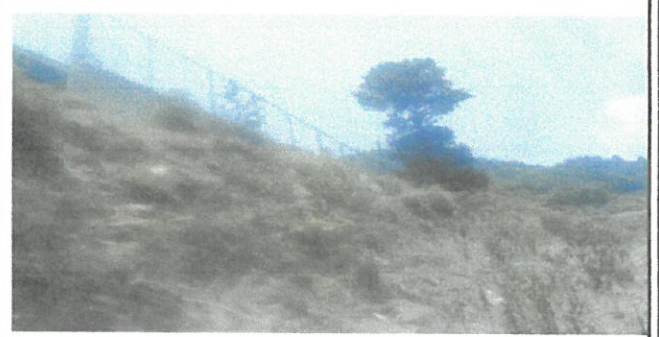
Vista externa de muro perimetral