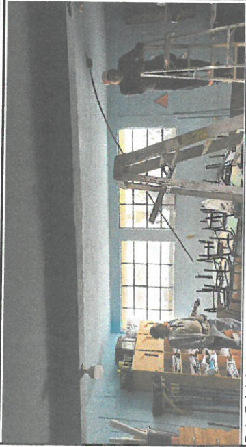
Foto 7: Inicio de cambio de cableado energía eléctrica aula 1er. Nivel