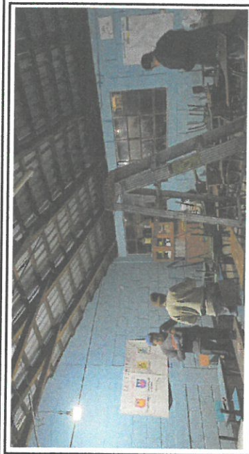
Foto 8: Inicio de cambio de cableado de energía eléctrica aula 2do. Nivel