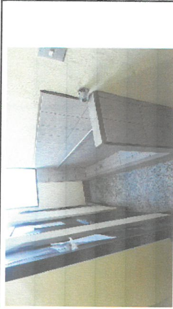
foto 3. intalación de piso nuevo de granito , trabajo drenaje, y tubos de agua potable en baños segundo nivel terminados