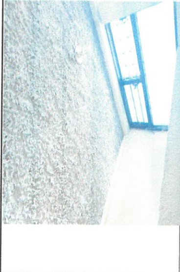
Foto 6. Daño colateral de humedad en los baños del primer nivel por filtración de agua hasta el goteo, está seco en parte por desuso de los baños del segundo nivel. Reparado

Observación: Si es necesario se pueden agregar hojas adicionales y actualizar el número de hojas.