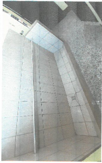
Foto 4. Demolición y reconstrucción de urinales y reparación de sus sistema drenaje