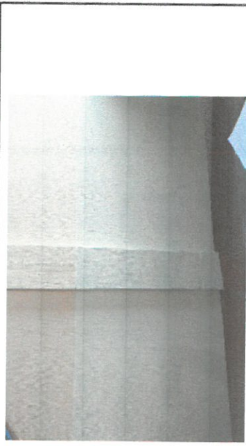
Foto 5. daño colateral de humedad en las paredes por filtración de agua reparado