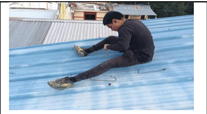
Foto 4: Proceso del cambio de los tornillos exclusivamente sobre las dos aulas del segundo nivel.