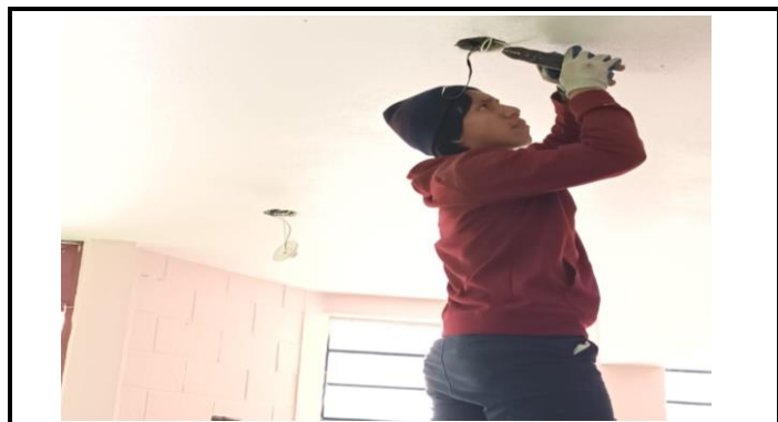
Foto 1: Realizando en trabajo de cambio del tendido electrico en una de las aulas de la EORM.