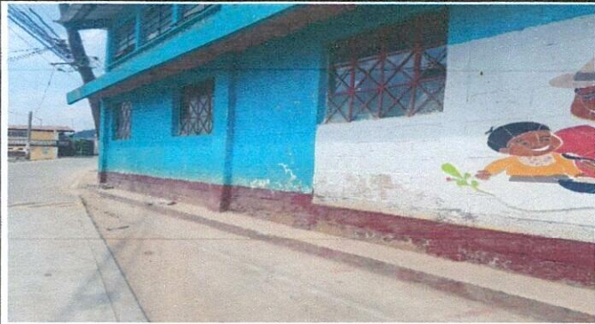
Foto1: vista de la pared exterior a pintar