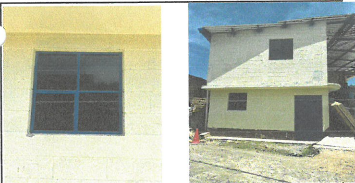
Vista de ventanas sustituidas