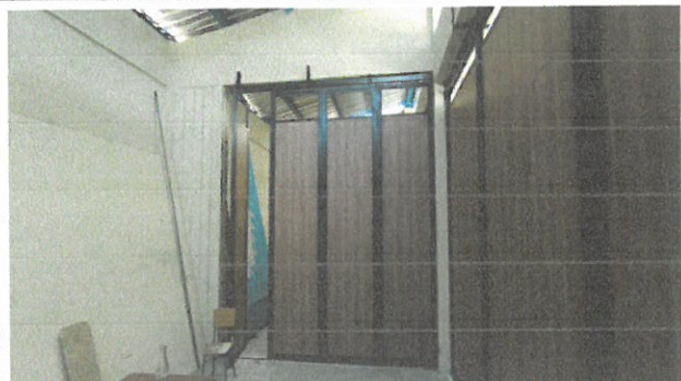
Vista de división finalizado