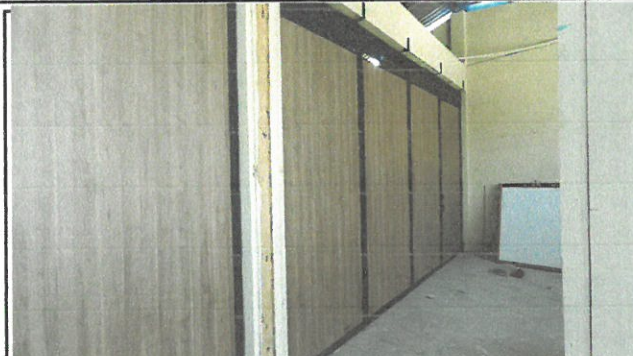
Vista de división de aula remozada