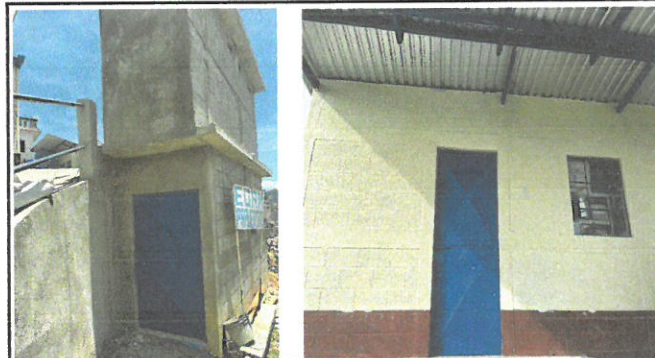
Vista de puertas de bodega y dirección sustituida