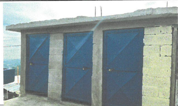
Vista de puerta de baño finalizado