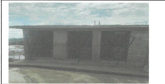
Vista de puertas de baño en proceso de sustitución