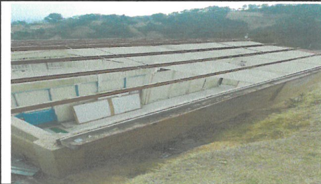
Vista de techo en proceso de remozamiento