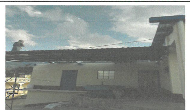
Galera en proceso de sustitución