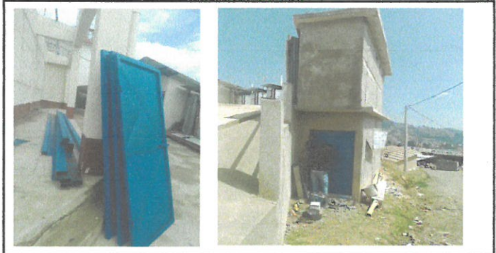
Vista de puertas en proceso de cambio