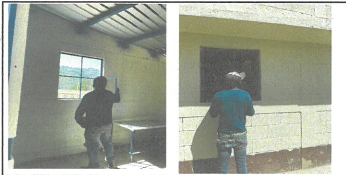
Vista de ventanas de proceso de cambio