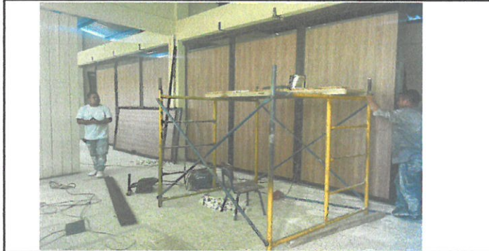
Vista de división de aula en remozamiento