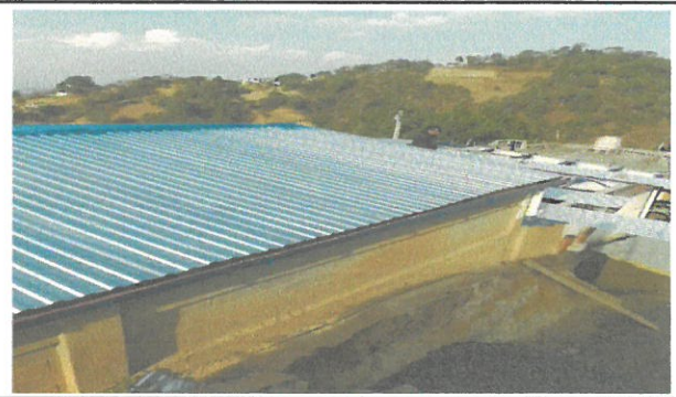
Vista de techo en proceso de cambio