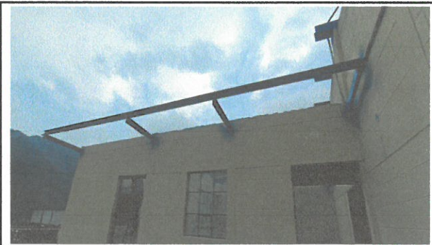
Vista de galera en proceso de cambio