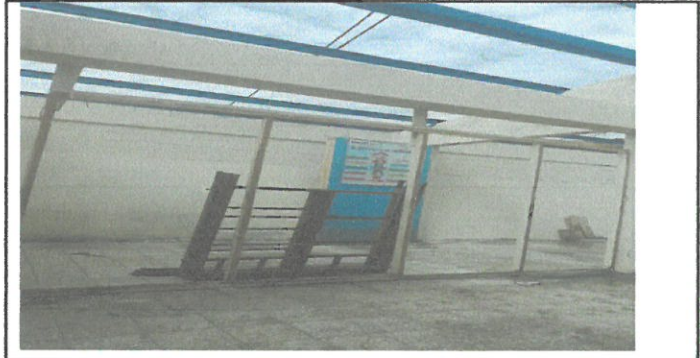
Vista de división de aula en proceso de sustitución