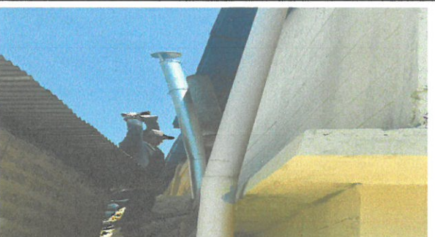
Vista de Chimenea en proceso de sustitución

Observación: Si es necesario se pueden agregar hojas adicionales y actualizar el número de hojas.