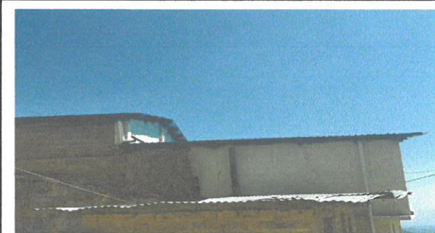
Vista de chimenea en proceso de cambio