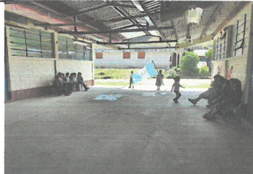
Foto 4: acto cívico en el corredor y patio de la escuela con nuevo techo.