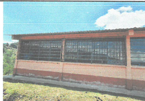
Foto 6: balcones de 2 ventanas exteriores o traseras de la escuela

Observación: Si es necesario se pueden agregar hojas adicionales y actualizar el número de hojas.