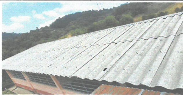
Foto 5: techo exterior del establecimiento a remozar y las ventanas traseras donde se colocará los balcones