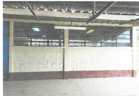
Foto 4: ventana del recorridor de la escuela donde se colocará el balcón