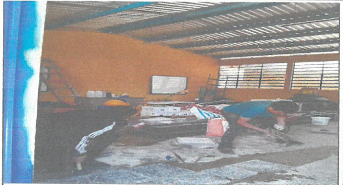
VISTA DE PISO EN REMOZAMIENTO