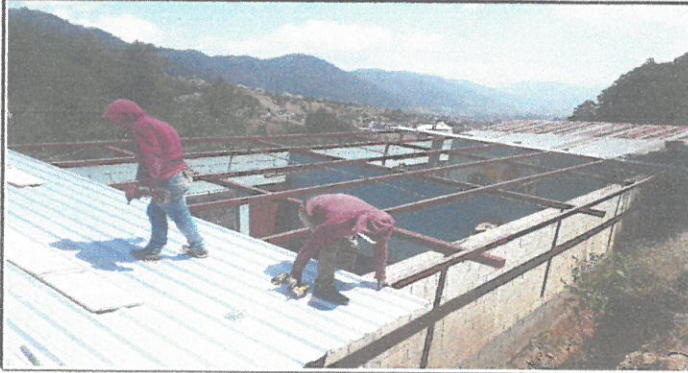
VISTA DE LÁMINAS EN REMOZAMIENTO