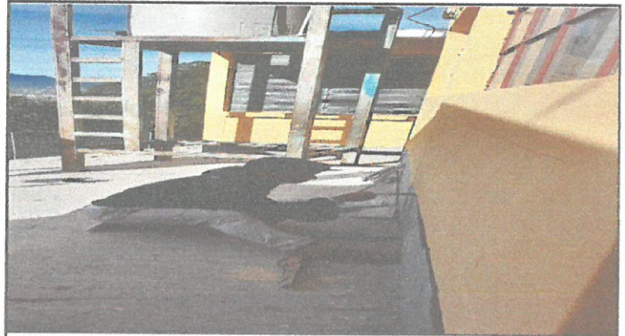
VISTA DE PAREDES EN PROCESO DE PINTURA