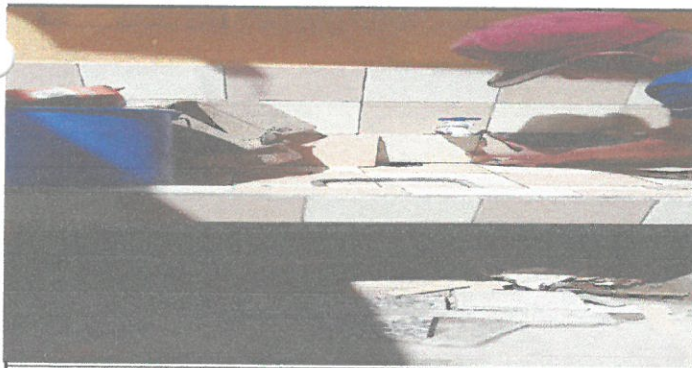
VISTA DE LAVAMANOS COLOCANDO AZULEJOS