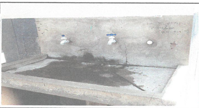
VISTA DE LAVAMANOS A COLOCAR AZULEJOS