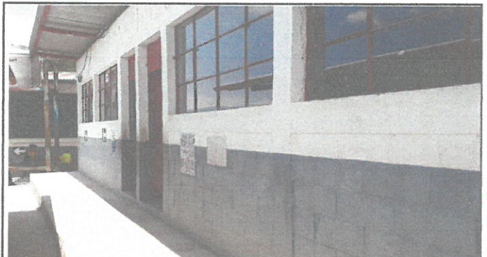
VISTA DE PAREDES A PINTAR