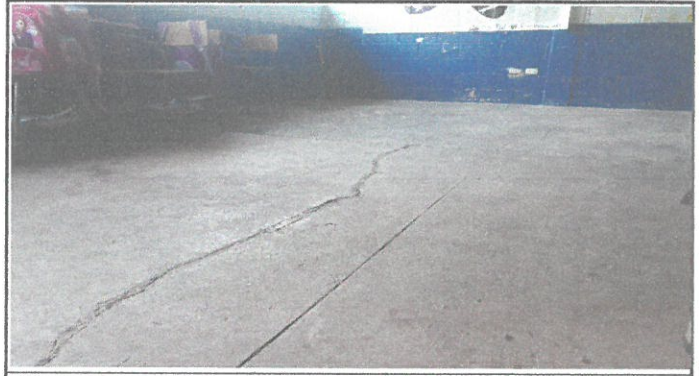
VISTA DE PISOS A REMOSAR DE CEMENTO A GRANITO DE MARMOL