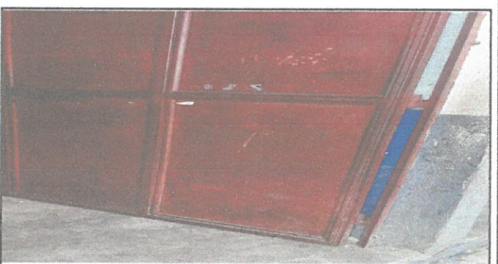
VISTA DE PUERTAS A REMOZAR

Observación: Si es necesario se pueden agregar hojas adicionales y actualizar el número de hojas.