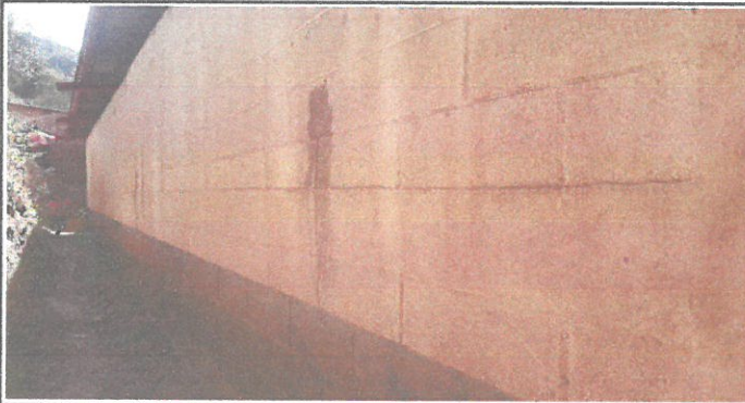
VISTA DE PAREDES EXTERIORES A PINTAR