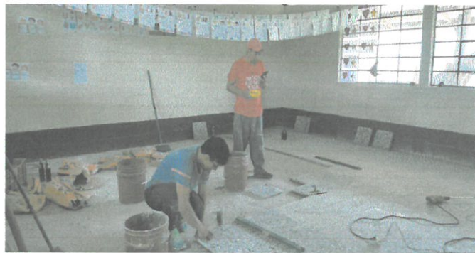
Foto1: Fotografía de trabajadores instalando piso de granito