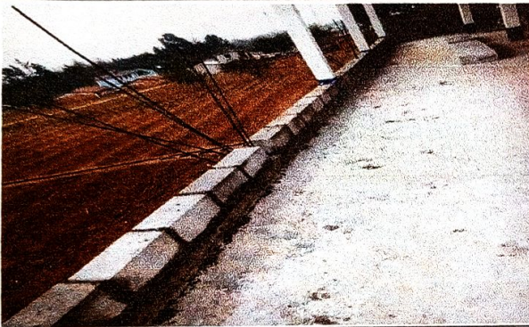
Foto 3: Vista del area a remozar con levantado de block y varandas de protección