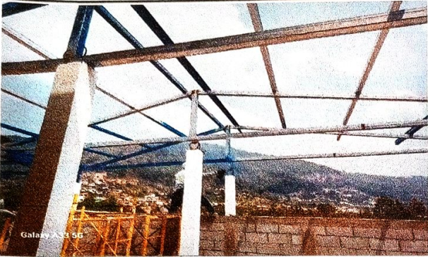
Foto1: Vista interior del area a remozar techo tanto estructura como cubierta