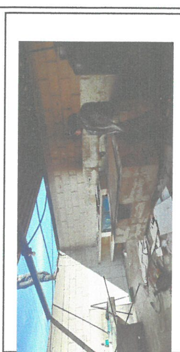
Remozamiento de techo de cocina

Observación: Si es necesario se pueden agregar fotos adicionales y actualizar el número de hojas.