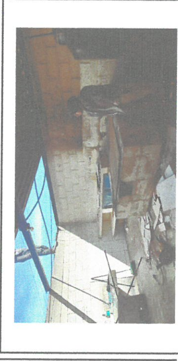
Remozamiento de area de cocina