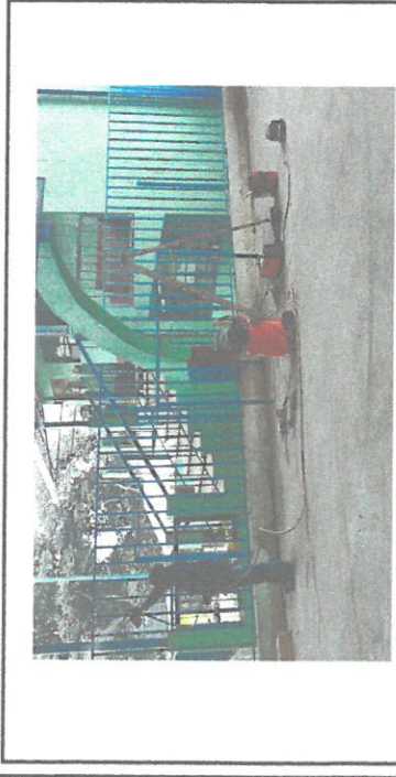
Sustitución de malla de metálica por estructura metálica