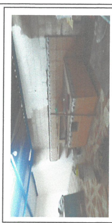
Remozamiento de piso de cocina