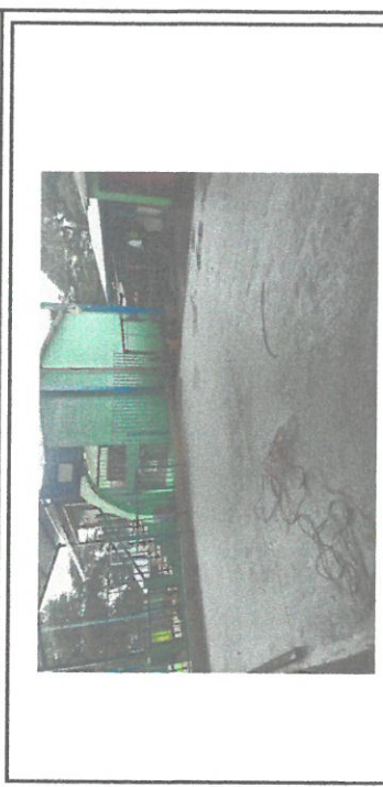
Reparación de losa de patio