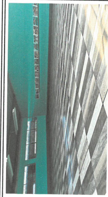
Foto 2: vista de piso cerámico ya finalizado en el modulo 1 aula No 2