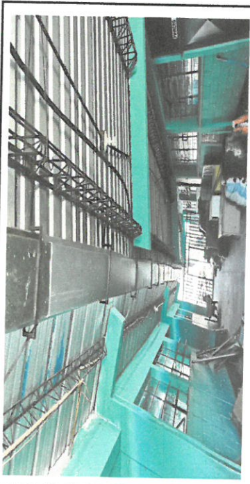
Foto1: Vista completa de canales para agua pluvial ya instalada del modulo 1 y parte del modulo No 2.