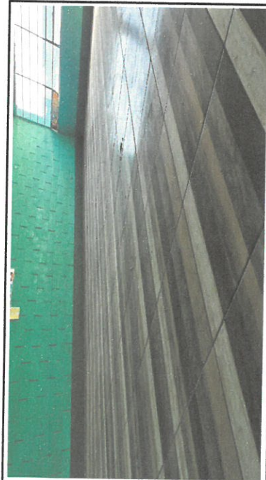
Foto 3: Piso de cerámico instalado en una de las aulas del modulo 1 aula No.3