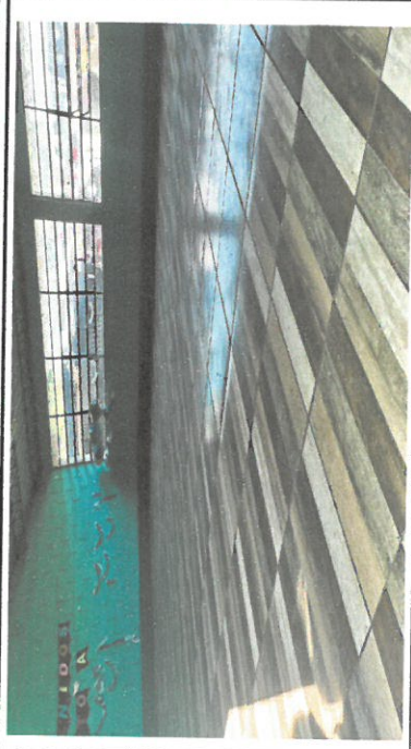
Foto 1: Vista completa de una de las aulas del modulo 1 aula No 1 ya finalizada.