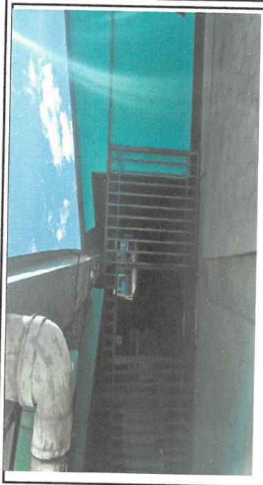
Foto 2: Fotografía de canales para agua pluvial de doble agua ya finalizada.