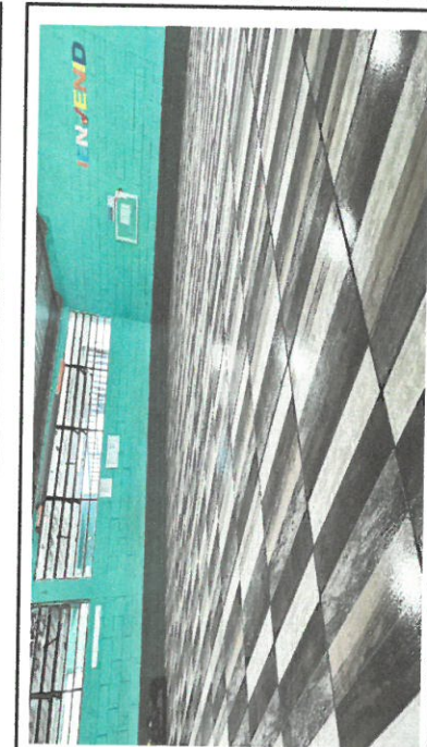
Foto 4: Otra aula con piso de cerámico instalado modulo 2 aula No.4