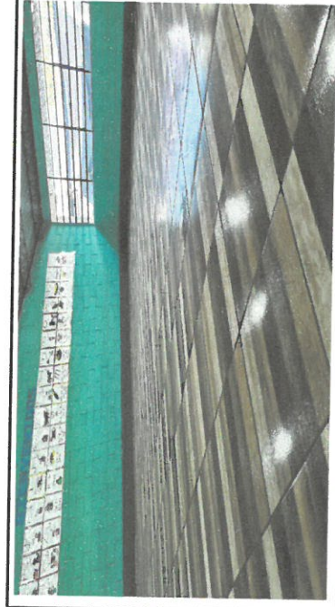
Foto 5: Vista completa piso de cerámico instalado modulo 2 aula No5