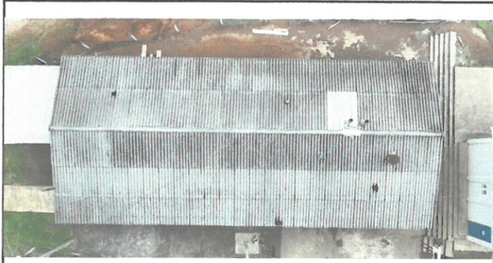
Foto1: Techo Edificio Escolar