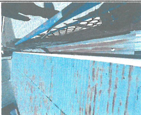
Foto 1: Condiciones en las que se encuentran el techo de las dos aulas