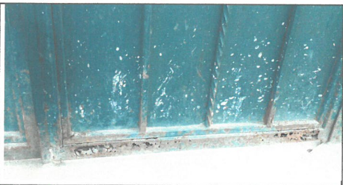
vista del deterioro del portón a remozar