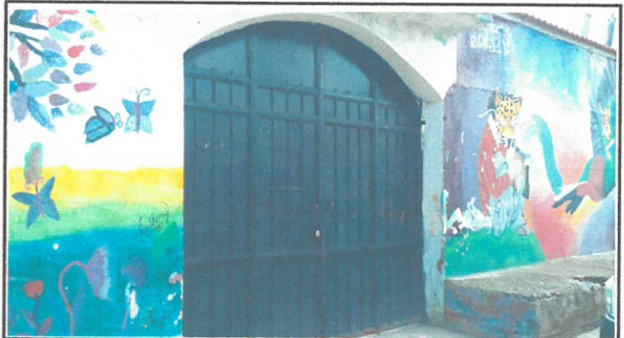
vista del portón a remozar con deterioro por dentro del establecimiento