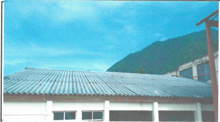
vista de techo de aulas a remozar