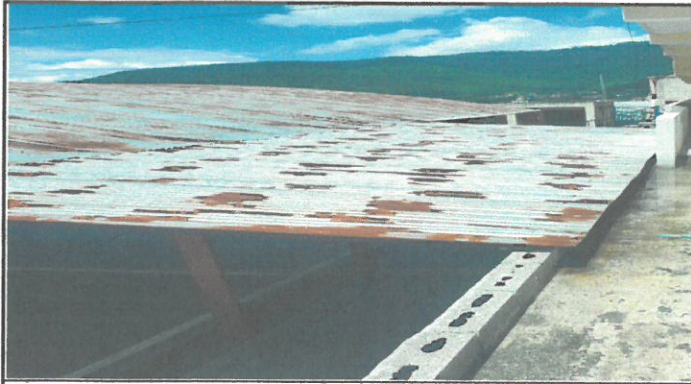
vista de área a remozar, reparación de cubierta de techo en pasillo